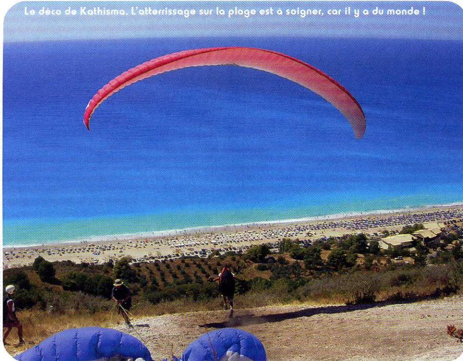
Le déco de Kathisma. L'atterrissage sur la plage est à soigner, car il y a du monde !